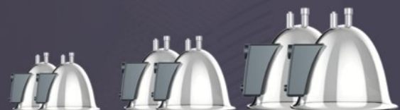
APPLIKATOREN FÜR BRUST- UND GESÄßSTRAFFUNG