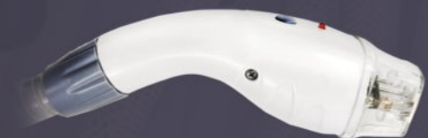
RADIOFREQUENZ HANDSTÜCK NR. 3 FÜR GESICHTSBEHANDLUNGEN