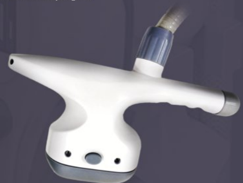
RADIOFREQUENZ HANDSTÜCK NR. 2 FÜR KÖRPERBEHANDLUNGEN